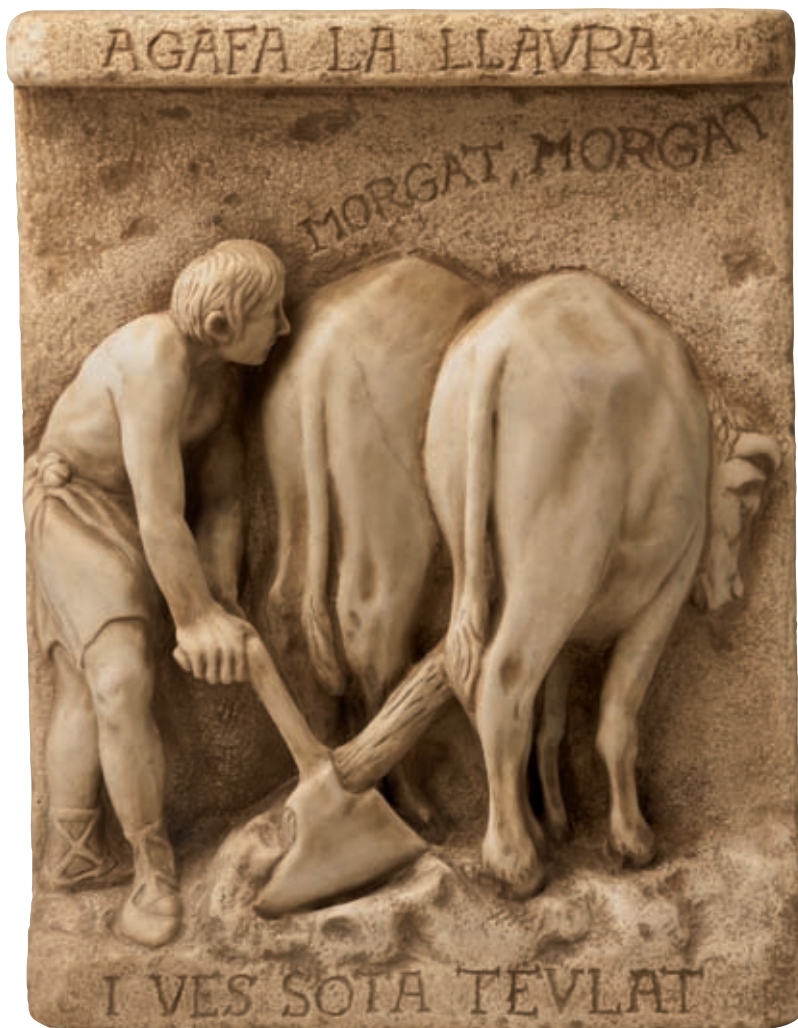
Il y a 250.000 ans - Banyoles (Girona).