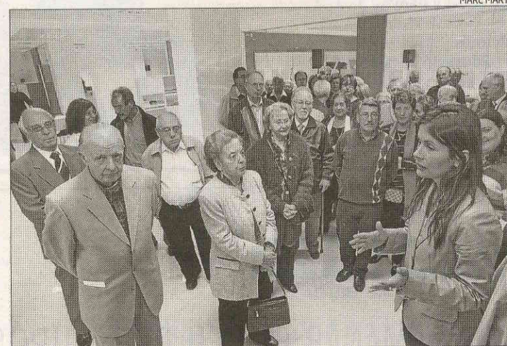
Parlaments de la reobertura del centre social de Caixa Catalunya.

Amb la remodelació, el centre ofereix nous serveis com ara equips informàtics amb connexió a Internet per tal d'apropar les persones grans a les noves tecnologies, un espai de cuina, una sala d'activitat física amb vestuaris i una aula poli-