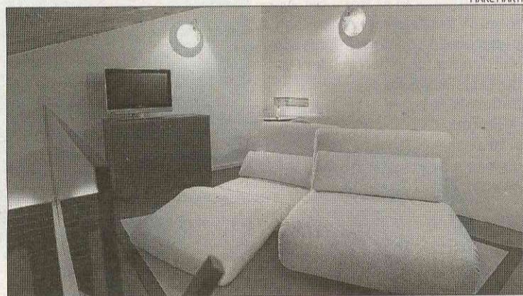
La part superior d'una de les habitacions dúplex.